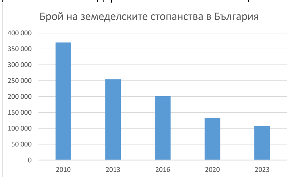
Фиг. 1. Динамика в броя на земеделските стопанства в България

По този начин емпиричният анализ остава строго фокусиран върху земеделските стопани и технологичното развитие на земеделските стопанства в България, без да се използват индиректни показатели за общото население.