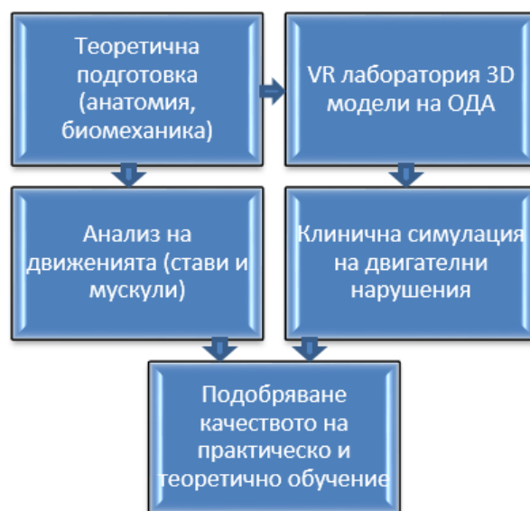
Схема 1. Основни етапи на интегриране в учебния процес

Лабораторията по анатомия включва и режим за съвместни занятия и лекции в реално време с до 100 участници, позволява свързаност с образна диагностика (СТ/MRI) и интегрирани автоматични тестове с оценяване и статистически анализ, което допълнително повишава ефективността на обучението (MU Pleven, 2025).